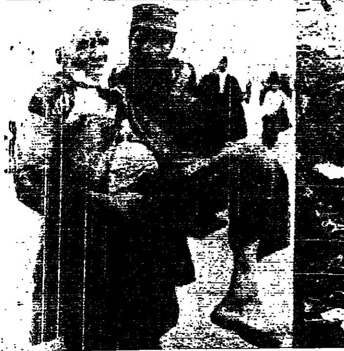
صورتان لاسكيتيان للنسوة من اليونانيات كاترين الارزل في ايران الى اليمن : الكاترين جيسا فسي انفاض الحن والقرى . والى اليسار : في الوفا القتل

٣ ضباط كبار لا ٣ جنود يسود الاعتقاد في الضفة الغربية ان اسرائيل قد قتلت ثلاثة ضباط كبار في الكمين الذي نصبه القذافيون على الضفة الشرقية لقناة السويس وليس ثلاثة جنود كما تقول اسرائيل . وذهب بعض الجاهل الى القول بان قائد البحرية الاسرائيلي الذي أعلن عن خلف له قبل يومين هو «الجندي» القتود في الكمين .